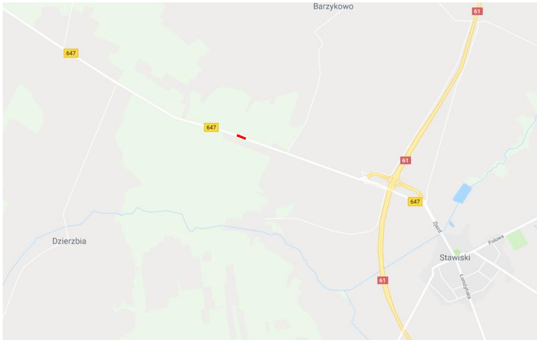
Rys. 1 PLAN ORIENTACYJNY SKALA 1:25 000